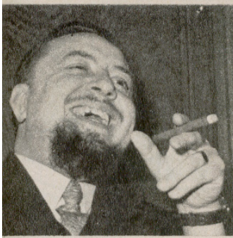
Men moet het leven langs de goede kant nemen.